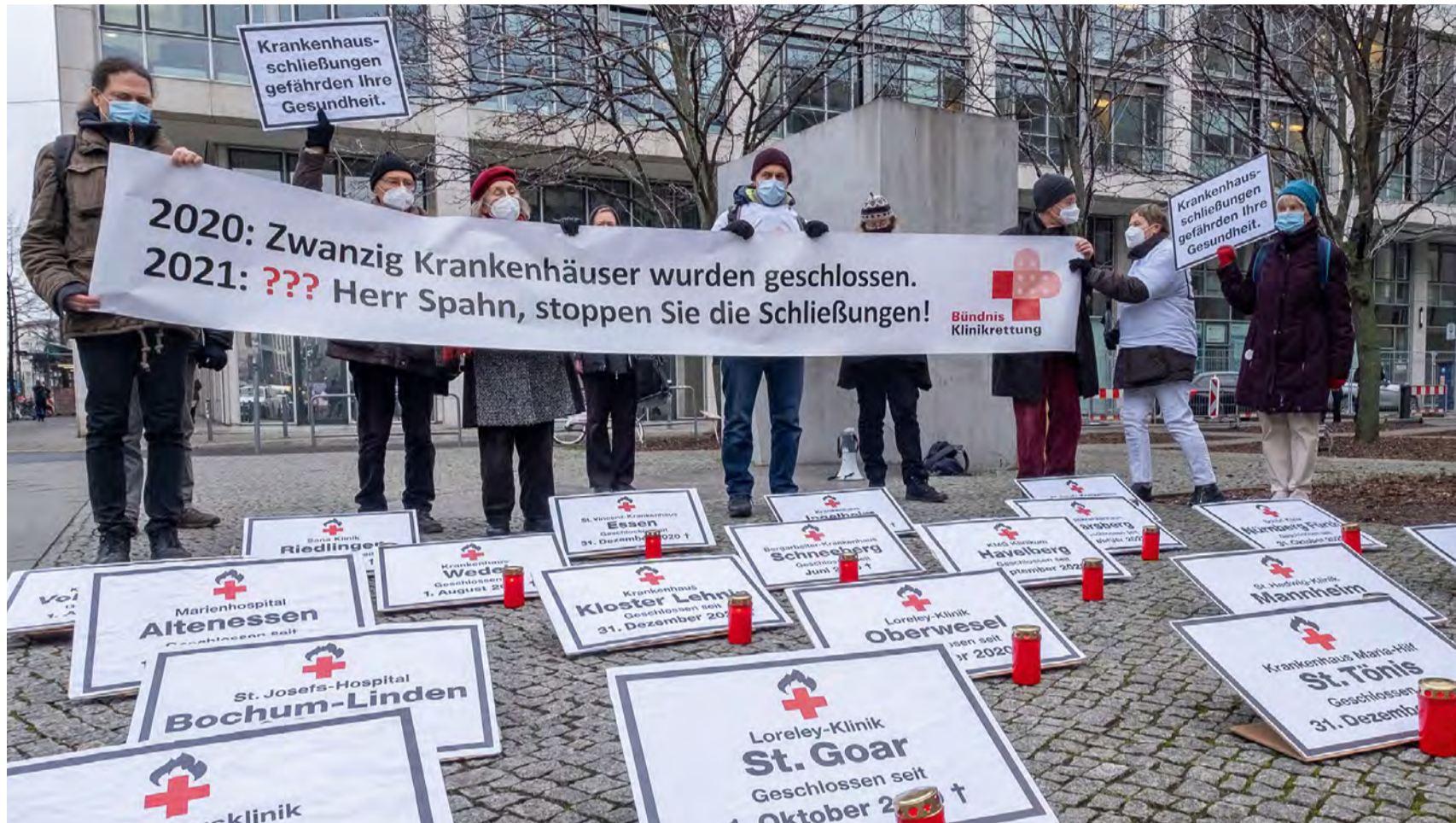
Bündnis Klinikrettung: Aktion am 27. Januar 2021 vor dem Bundesgesundheitsministerium in Berlin

Jedes zehnte Krankenhaus steht kurz vor der Insolvenz, warnt der Bundesrechnungshof. Vier von zehn Krankenhäusern würden rote Zahlen schreiben. Ja, sehr viele Krankenhäuser sind krank. Diese Epidemie wütet inzwischen im ganzen Land. Gab es 1980 noch 3.783 Krankenhäuser mit 879.605 Betten in Deutschland, sind es heute knapp 2.000 mit etwa 500.000 Betten. Die Liegezeit hat sich auf eine Woche halbiert, mehr als 60.000 Stellen im Pflegebereich wurden gestrichen. Wie kam es zu diesem Kahlschlag? Von Bernd Hontschik