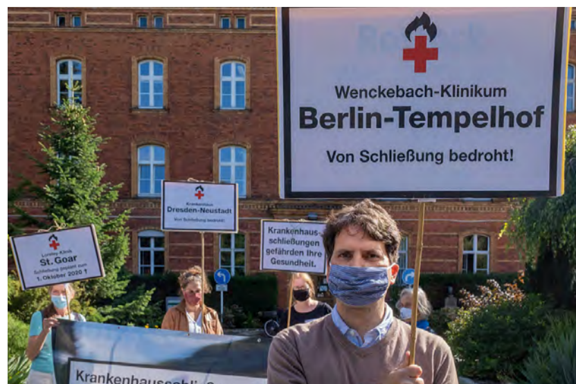
Demo im September 2020 vor dem Wenckebach-Klinikum

Unterschriftensammlungen und Bürgerentscheide zum Erhalt von Kliniken erhielten allein in den letzten fünf Jahren 436.000 Stimmen. Es lohnt sich: Schließungen können verhindert, Privatisierungen zurückgenommen werden. Zusätzlich zum lokalen Widerstand ist die überregionale Vernetzung wichtig, um mehr Druck aufzubauen: in der Aktionsgruppe Stoppt das Kliniksterben in Bayern , in der Initiative Regionale Krankenhausinfrastruktur erhalten in Nordrhein-Westfalen und im Bündnis Klinikrettung auf Bundesebene.