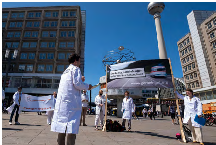
GiB-Aktion auf dem Alexanderplatz am Tag der Daseinsvorsorge

Profite dürfen nicht vor der Gesundheit rangieren. Wir müssen schleunigst zum Grundsatz zurückkehren, dass Gesundheit keine Ware ist. 96 Prozent der Bevölkerung gaben im Juni 2020 an, dass ihnen PatientInnenversorgung wichtiger ist als Wirtschaftlichkeit im Krankenhauswesen.